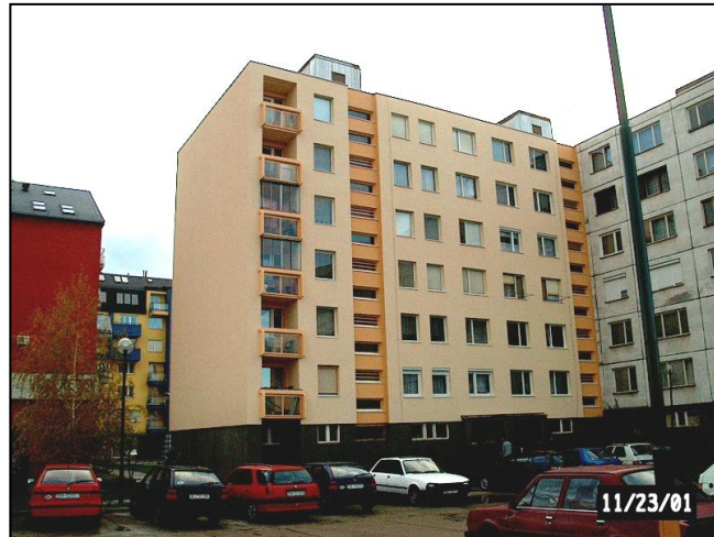
Celkový pohľad na obnovený bytový dom Pri Šajbách č. 30 v Bratislave – zadné priečelie

Contact thermo-protecting system is the most effective as the additional thermal protection. The thickness of thermal insulation was calculated complexly on the base of heating savings and hygienic criterions. The boards of foam polystyrene or mineral fibres boards in thickness 60 mm were designed for the additional thermal insulation. The dowels, which declared a carrying capacity either for porous concrete material, were used. Baumit - the contact thermo-protecting system were applied.