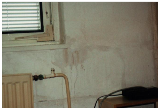
▲ Trhliny a záteky na vnútornom povrchu pórobetonových spínaných dielcov

View on the probe made in the place of switching rod with missing grout