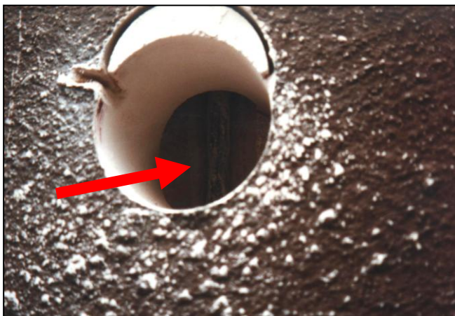
▲ Pohľad na miesto sondy s chýbajúcou zálievkou spínacieho tiahla

View on the probe made in the place of switching rod with missing grout