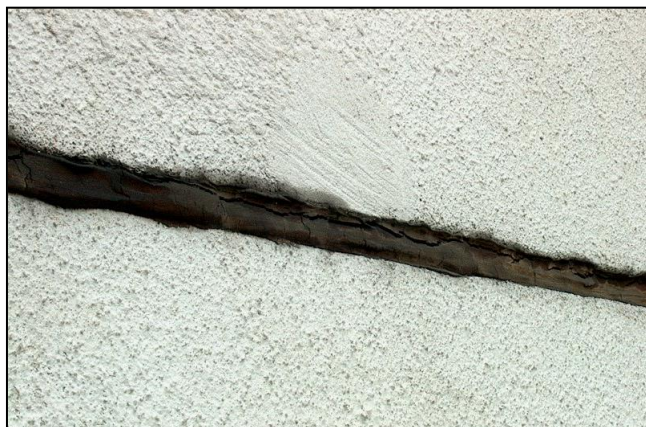
Pohľad na trhliny v tmeli uzavretých škár medzi pórobetónovými obvodovými dielcami

Budova sa nachádza v rovinatom území Bratislava - Rača. Postavená bola v roku 1988 v stavebnej sústave P 1.15 s obvodovým plášťom z pórobetónových spínaných dielcov hrúbky 300 mm. Jedná sa o bytový dom s jedným vstupom so 7 nadzemnými podlažiami. Z toho je 6 obytných podlaží a jedno podlažie technické - vstupné. Dom je orientovaný pozdĺžnou osou približne na juhozápad - severovýchod so vstupmi v priecheli juhovýchodnej orientácie. Komunikačné jadro tvoria dve schodiská, každé s osobným výťahom. Vstup do budovy je cez uzatvárateľné zádverie. Bytový dom má zapustené lodžie.