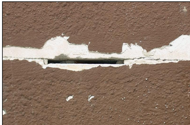
Trhlina v mieste škáry medzi prvkami vyplnená maltou pri kompletácii pórobetónových panelov (systémová porucha)

The dwelling house is located on a flat area of Bratislava – Rača. The house was built in 1988 in P 1.15 - structural system with overall walls from claps porous concrete elements in thickness 300 mm. The house is one sectional with 7 storeys. 6 storeys are for dwelling aim and 1 storey is technical-entrance. The house is orientated by longitudinal line to the south-west and the north-east side. The entrance is orientated on the south-east side. The communication way is made by two stairs and by two personal elevators. The main building entrance passes across the closing door space. The dwelling house has imbedded loggias.